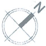
Схема розміщення об'єктів торгівлі під час проведення ярмарку по вул. Новопирогівська, 25/2-29 в Голосіївському районі м. Києва