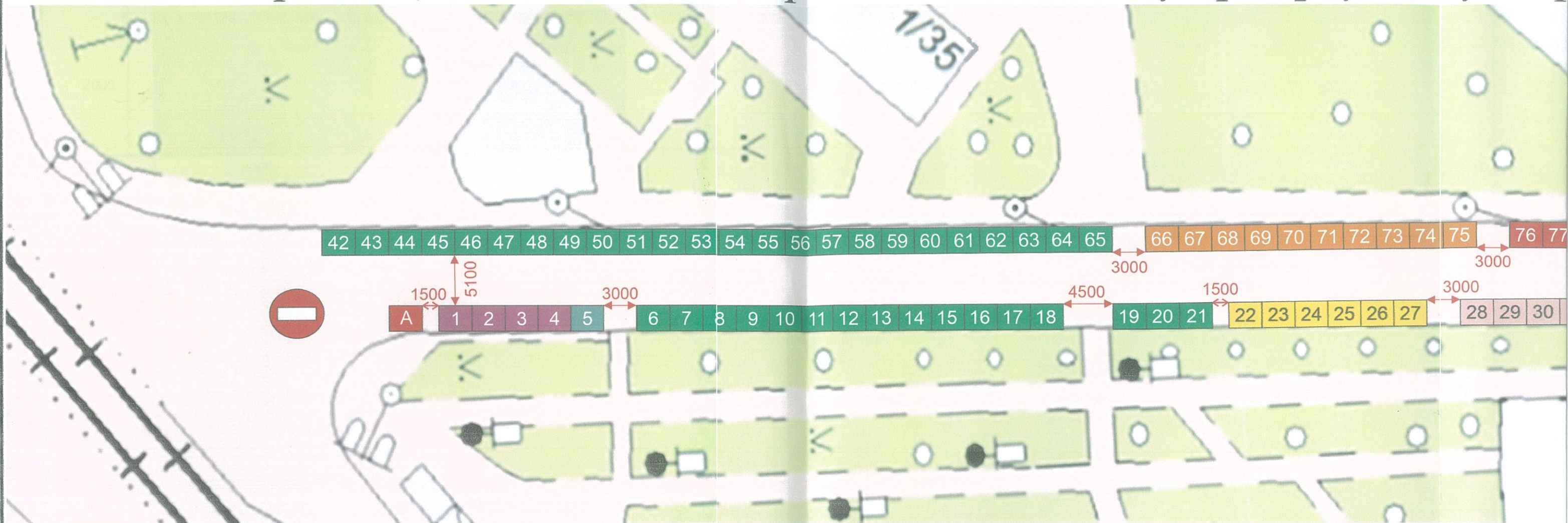
Схема розміщення об'єктів торгівлі на сезонному ярмарку по вул. Г

Техніко-економічні показники: Торговельних місць - 100 шт.